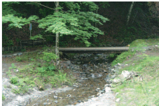
横浜市の水源のひとつ、道志川の風景

横浜市の水源のひとつである“道志川”。この水源を守っていくため、山梨県道志村に“水源の森”を作る取り組みが「水源エコプロジェクトW-eco・p (ウィコップ)」です。